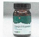
Omega 3 Supreme