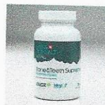
Bone & Teeth Supreme